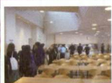
栄養満点の食事が 毎日提供される 食堂