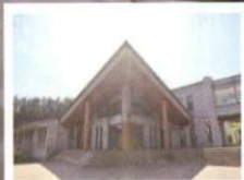
二本松訓練所 外観