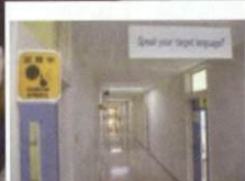
訓練言語を 学ぶフロア