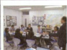
派遣国への イメージ膨らむ 語学授業