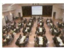
安全管理など、 各種講座を学ぶ 講堂