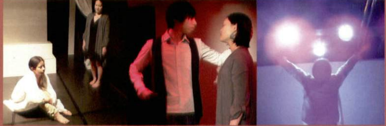
●Whiteプロジェクト 「あの日、白い雪が舞った」 2014年 東北被災地ツアー予定 参加者募集中!