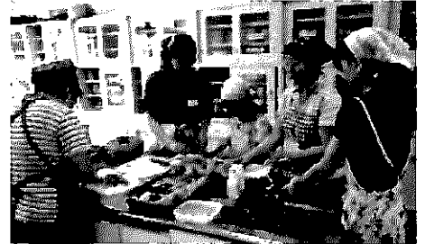
過去の講座の様子※会場は別の場所です。