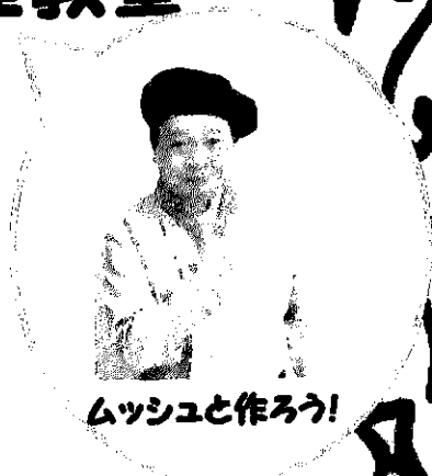
ムッシュと作ろう！

メニュー： かつおの手こね寿司・かつおのチーズ焼き はんぺんのお吸い物・あじさい寒天