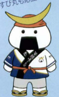
宮城県観光PRキャラクターむすび丸