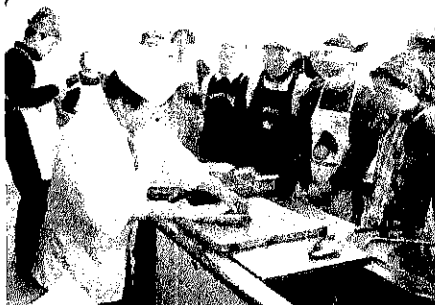
前回はサバを調理しました