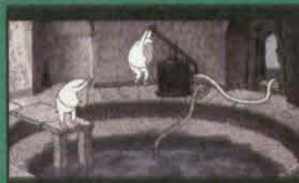
潮の満ち引き (TIDES TO AND FRO)