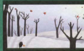
小鳥とほら紙 (THE LITTLE BIRD AND THE LEAF)