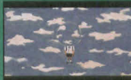
くも男 (A GUM BOY)