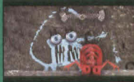
ベルリン・リサイタルズ (BERLINALE RETROSPECTIVE)