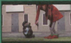
緑島のハリネズミ (GREGHOWS AND THE CITY)