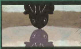
髪うまさの道 (THE PATH OF A HAIR)