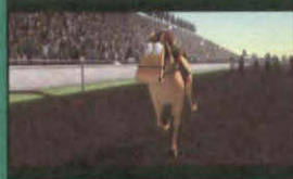
イオシダ・ホープ (RISING HOPE)