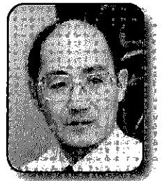
昭和大学名誉教授 歯学博士 日本尊厳死協会東北支部理事