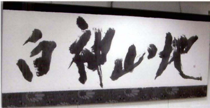
書画「白神山地」 製作：鎌田雨溪氏