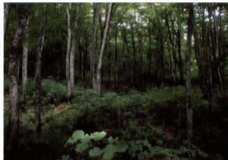
ブナ林 (クマゲラの森)