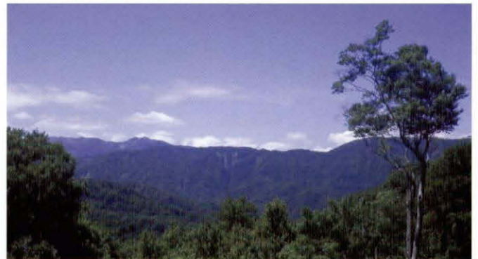
津軽峠から見た白神岳