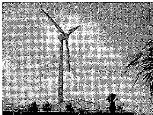
左上より時計回りにバイオマス発電所（兵庫県） ／太陽光発電所（神奈川県）／風力発電所（鹿児島県） ／地熱発電所（鹿児島県）