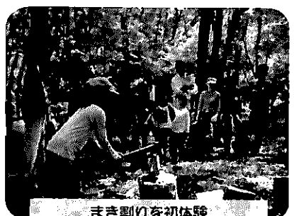
まき割りを初体験