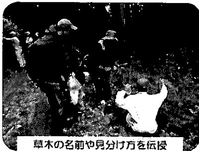
草木の名前や見分け方を伝授