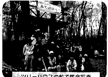
ツリーハウスの前で集合写真