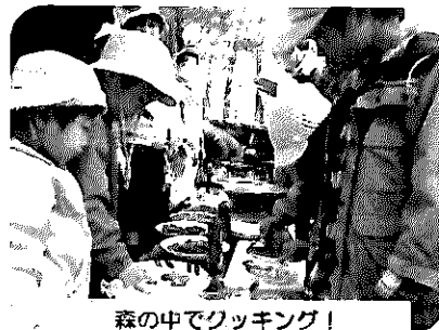
森の中でクッキング！