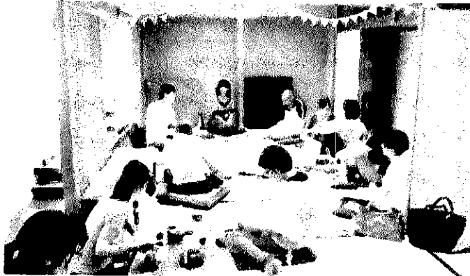
写真はvol.11青葉区中央市民センターでの様子です

bun bun cafeは原発や放射能に関するおしゃべりと情報交換の場です。 ミニレクチャーもあります。おいしいお菓子とお茶でなごみながら、 安心してしゃべれる場をつくっていきたいと思っています。