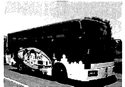
ワケル君バスで移動します。

トレーや容器包装プラスチックの再生工場です。家庭から出たプラごみを原料にリサイクルパレットの製造をしています。