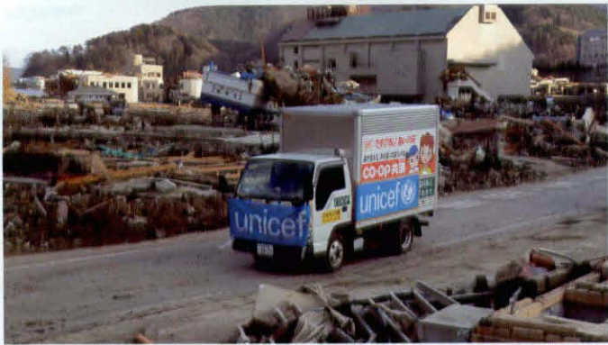
ユニセフの救援物資を乗せ、被災地を走るみやぎ生協の支援トラック。宮城県や岩手県では30年以上にわたりユニセフを支援してきた生活協同組合が救援物資を各地の避難所まで輸送した=2011年3月23日、宮城県女川町

2011年3月11日、日本は東日本大震災という未曾有の大災害に見舞われました。その直後から、日本ユニセフ協会には、国内外から被災した子どもたちのために温かい支援が寄せられました。ニューヨークのユニセフ本部もまた、日本ユニセフ協会を通じ、約半世紀ぶりとなる日本への支援を表明しました。