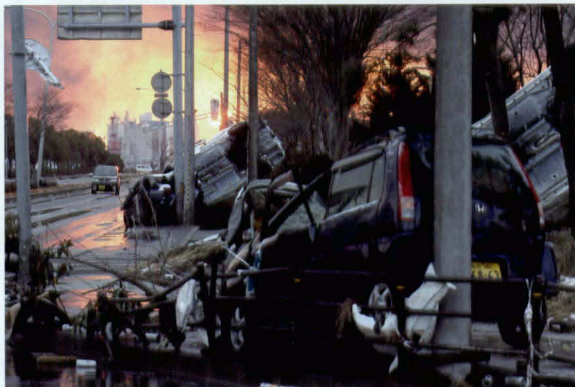
仙台港付近では津波で流された車が散乱していた。後方ではコンビニートが燃えている =2011年3月12日午後6時、仙台市宮城野区港2丁目