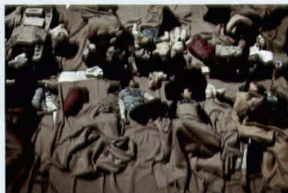
原発事後で避難、体育館で寝る福島県浪江町の子どもたち=2011年3月17日、山形市総合スポーツセンター