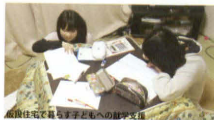
仮設住宅で暮らす子どもへの就学支援

仮設住宅でのコミュニティづくりのお手伝いをしています。住民が集える場をつくるために集会所の前に机・椅子を設置したり、集うきっかけをつくるためにイベントを開催したりしています。