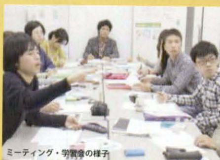
ミーティング・学習会の様子

POSSEは若者の労働・貧困問題に取り組むNPOです。活動内容は、貧困・福祉分野、教育分野、労働分野と多岐にわたっています。就学支援に関わりたい、貧困・教育問題に関心があり勉強をしてみたいという方は、本セミナー・ボランティア説明会にご参加いただくか、下記連絡先までご連絡ください。