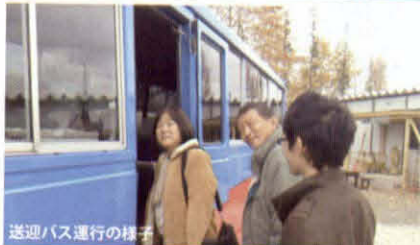
送迎バス運行の様子

POSSE とは、労働相談、労働法教育、調査活動、政策研究・提言、文化企画を若者自身の手で行う NPO 法人です。現在、会員は約 250 人。10 代、20 代を中心に、約 100 人のメンバーで運営しています。年間およそ 400 件の労働相談に対応しています。事務所は東京の下北沢、京都、仙台に構えています。