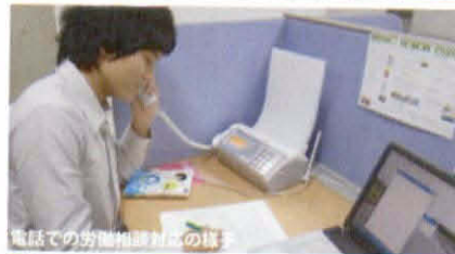
電話での労働相談対応の様子