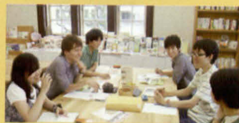
ミーティング・学習会の様子