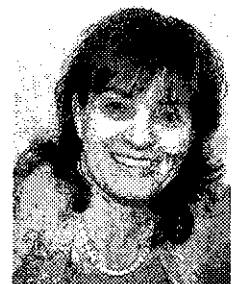
マスクット・ショシャット