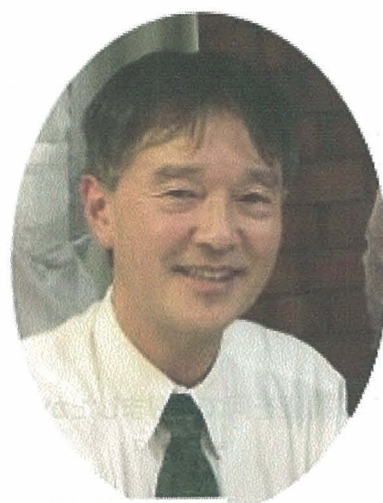
ストレスとうつがわかる本

略歴●昭和56年山形大学医学部卒業●山形県天童市生まれ●東谷メンタルヘルス研究所所長●山形大学医学部卒業後、同大学大学院、山形県立中央病院心療内科・精神科医長を経た後、フリーの精神科医となり産業保健に軸足を移す。現在、精神科産業医として契約事業所を訪問するなどの傍ら、亡き父の詩を継ぎ、昭和52年より浄土真宗 徳正寺(とくしょうじ)の住職も務める。●山形産業保健推進センター相談員、精神障害の労災判定委員など 著書●2006年『ストレスと「うつ」がわかる本』(株)テンタクル●2010年『このたび「うつ」になりまして～誰でも分かる職場のうつ対策～』(株)テンタクル