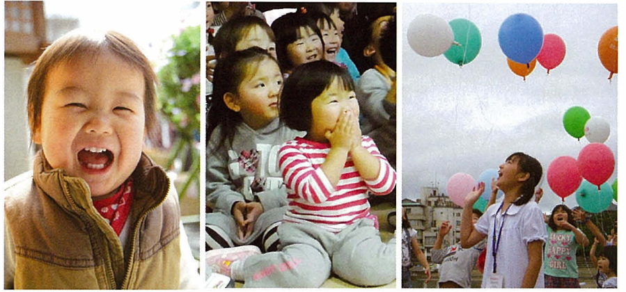
子供たちの笑顔は明日への希望だ

あの日からはや一年。 私たちは、たくさんの大切なものを失った。 しかし、深い悲しみの中から、 忘れかけていた大切なものがよみがえった。 日本人として生きる誇り ほこ と家族の絆 きずな 、 そして、明日を信じる勇気と力一。 いま、復興に向けて私たちは立ち上がる。 あまたの御霊 みたま へ鎮魂 ちんこん の祈りを捧げて……。