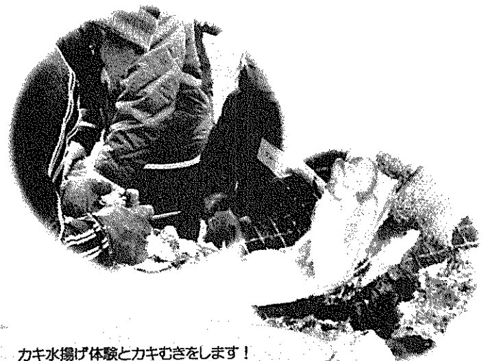
カキ水揚げ体験とカキむきをします！