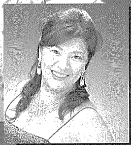
Soprano 大山 亜紀子