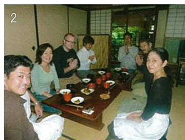
①合格者ミーティングは、年代や職業を超えての交流の場で、大盛り上がり！②町家を訪ねて食事を作ってみたい...