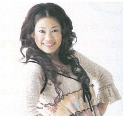
RIMI（東京/リ・スマイル）