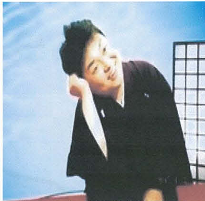
福団治亭一福（大阪）