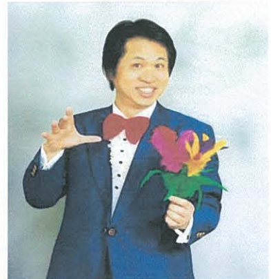
マジック・トシマ（東京）