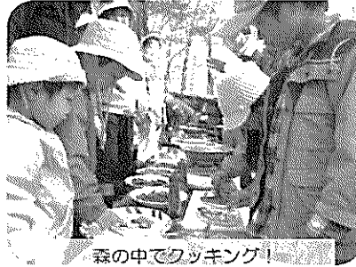
森の中でクッキング！