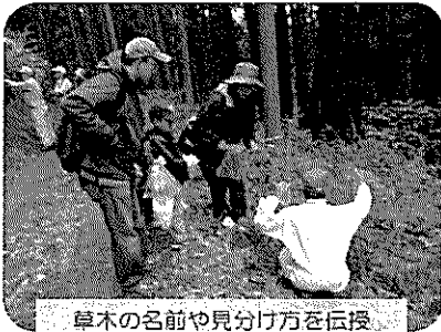
草木の名前や見分け方を伝授