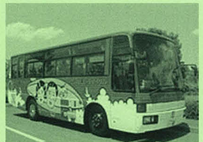
ワケル君バスで移動します。

古紙の回収(段ボール・新聞・雑誌・上質紙・色上質紙・その他)や古紙再生事業全般を行っている会社です。