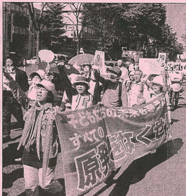
【写真右】原発なくせと仙台をデモ行進（6月11日）

3月11日の大地震、津波、そして原発事故。私たちの生活はその日から大きく変わりました。