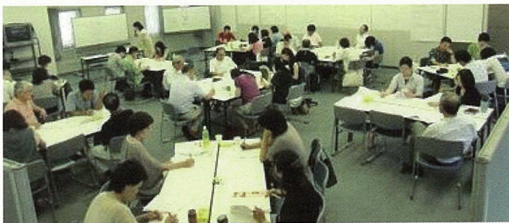
<去年のセミナーの様子 タイプごとの独特の空気感がおもしろい>