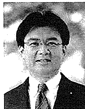
衆議院議員 秋葉賢也

なかの・たけし——1971年、神奈川県生まれ。京都大学大学院工学研究科 (都市社会工学専攻) 助教。 1996年、東京大学教養学部教養学科(国際関係論)を卒業後、通商産業省(現経済産業省)に入省。2000年より3年間、英エディンバラ大学大学院に留学し、政治思想を専攻。2001年、同大学院より優等修士号(Msc with distinction)取得。2003年同大学院在学中に書いた論文がイギリス民族学会 (ASEN) Nations and Nationalism Prizeを受賞。2005年、同大学院より博士号(社会科学)を取得。経済産業省産業構造課課長補佐等を経て現職。著書に、「考えるヒントで考える」「成長なき時代の「国家」を構想する」「自由貿易の罠 覚醒する保護主義」「恐慌の黙示録～資本主義は生き残ることができるのか」など。