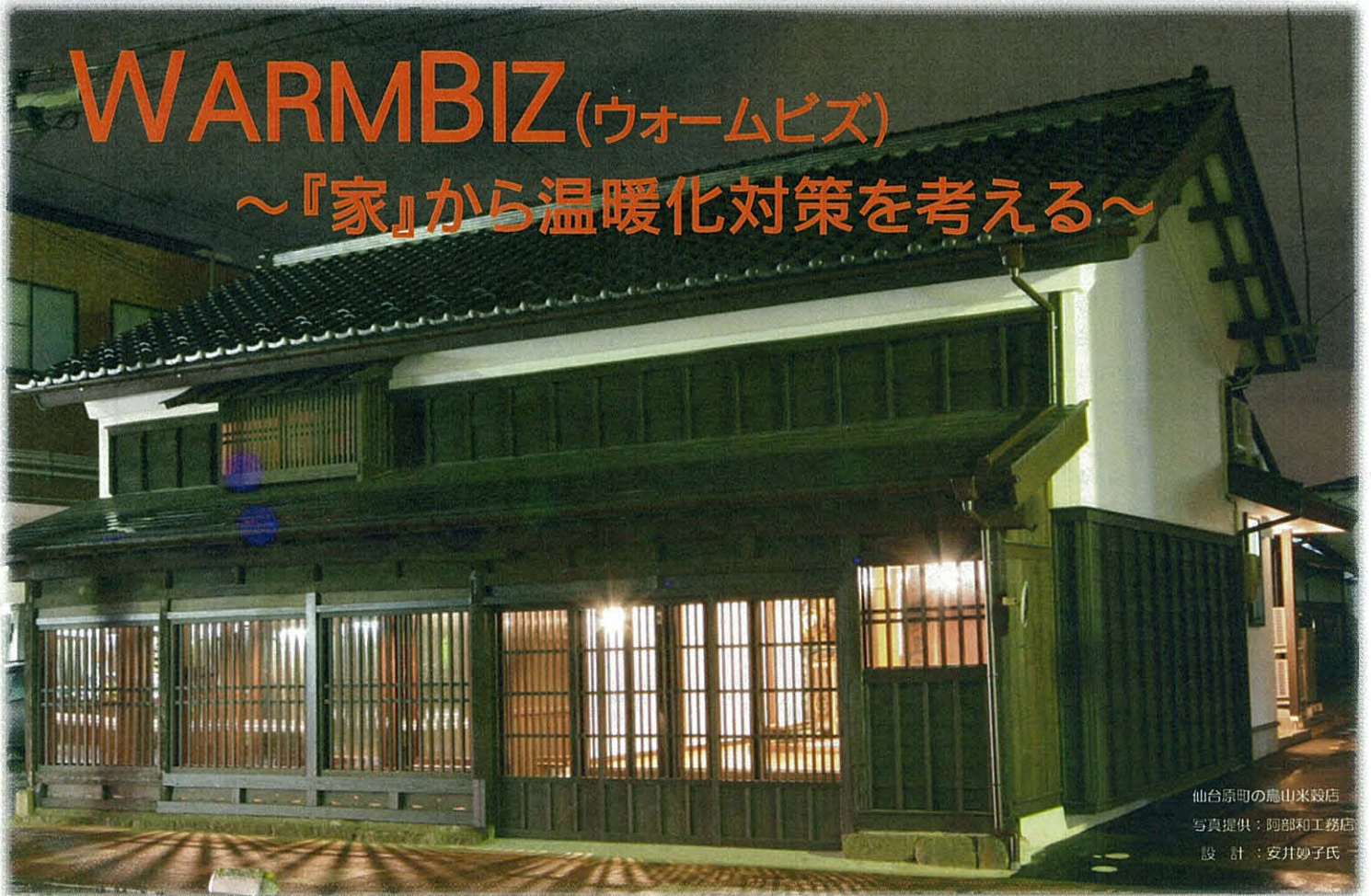
仙台原町の鳥山米穀店 設計：安井妙子氏