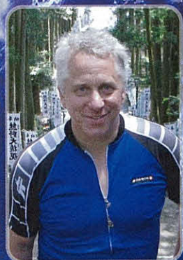
グレッグ・レモン ツール・ド・フランス覇者