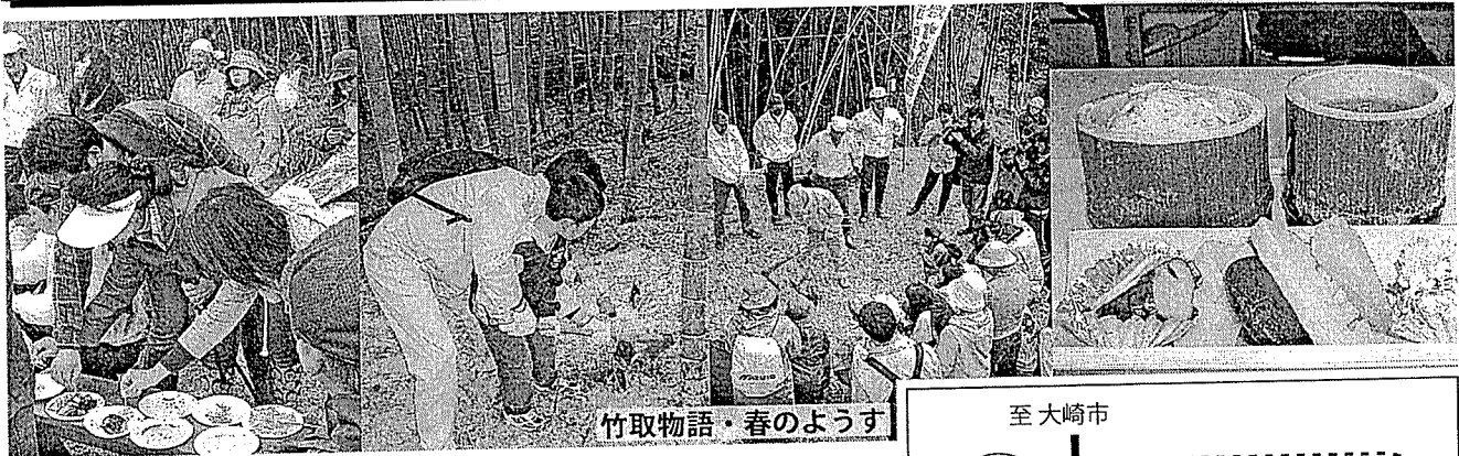
竹取物語・春のようす

料金 一般3,000円(お土産付) 定員35名・先着順 (両日とも) 小学5年生~中学生 2,000円