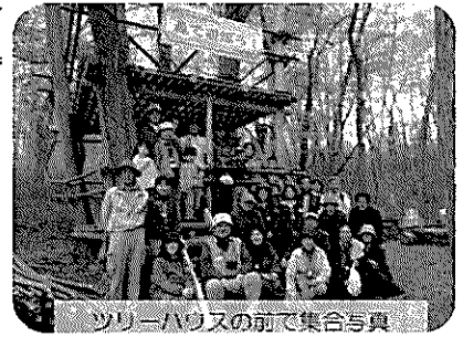
ツリーハウスの前で集合写真