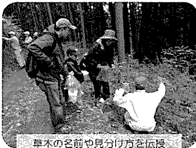
草木の名前や見分け方を伝授