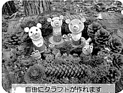
自由にクラフトが作れます