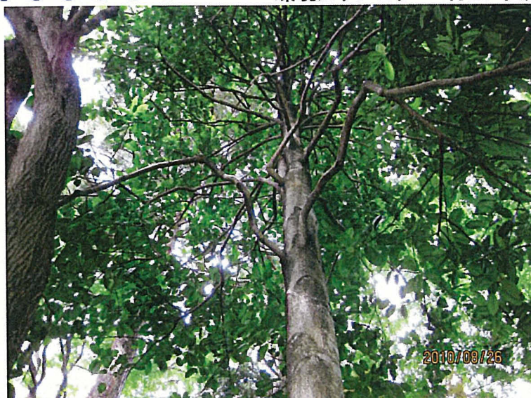
タイサンボク CBD/COP10NAGOYA 参加者壮行会 表彰式

COP10 支援実行委員会とNPO 法人LEAF26主催のみやぎ自然観察会は、4月から計6回のプログラムを無事終了し、最終章「地球の生物多様性を探る」を伊藤先生が解りやすく語ります。自然観察会参加者の表彰式と COP10(10 月8日~)に参加者の壮行式も兼ねます。ブースやステージ発表をモリコロ広場で行います。常設展示でもみやぎの豊かな自然を紹介してきます。