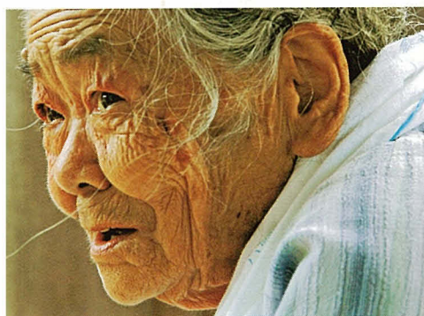
木田英之「終の住処」(6枚組) 奨励賞