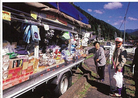
林武男「移動スーパー」(単)入選