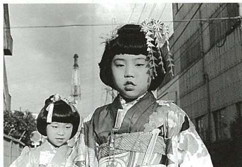
玉井敏夫「コンビニートの街 川崎・扇町1980年~83年」(8枚組) 優秀賞