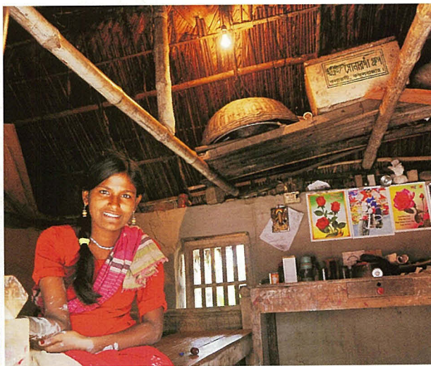
江幡美英「クルナに暮らす(バングラデシュ)」(8枚組) 奨励賞