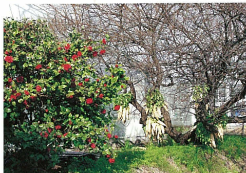
北川孝子「回想」(6枚組) 優秀賞