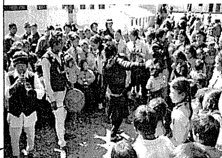
マハカリ小学校落成式の様子（2010-2）