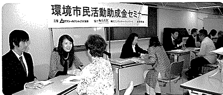
セミナー会場風景