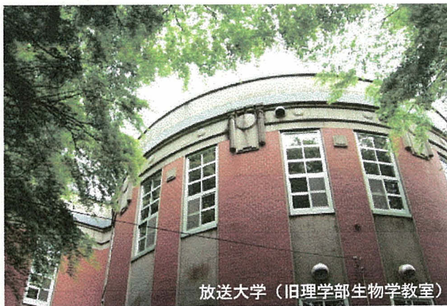
放送大学 (旧理学部生物学教室)