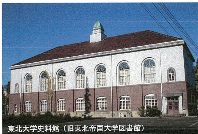
東北大学史料館 (旧東北帝国大学図書館)