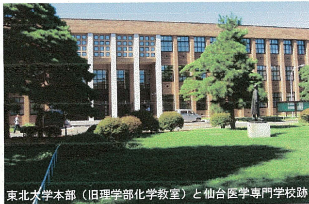
東北大学本部 (旧理学部化学教室) と仙台医学専門学校跡