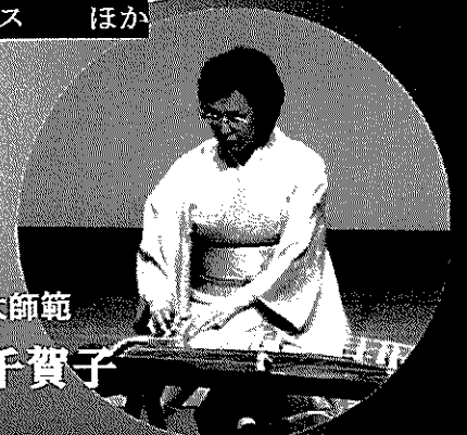
生田流宮城社大師範