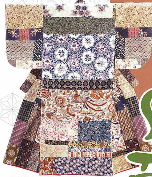
百徳きもの「憧憬」 木綿(更紗) 製：明治～大正 女兒一ツ身 和更紗とヨーロッパ更紗を接ぎ合せ、 はるか異国への憧れを表した