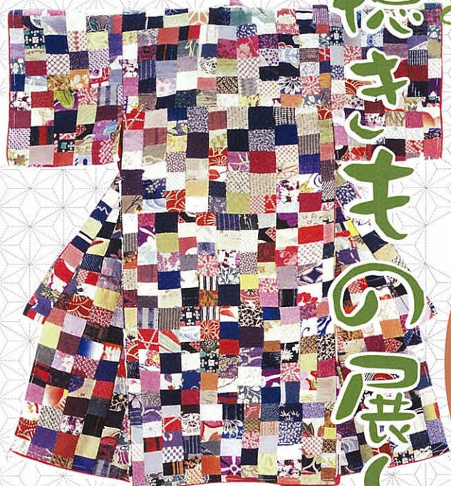
百徳きもの「華子」 絹(縮緬、他) 製：明治～大正 女兒一ツ身 およそ700枚の端布を使用 「華ある子」の意味が込められている