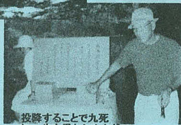
投降することで九死に一生を得たシムクガマ