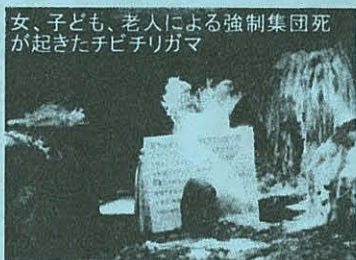
女、子ども、老人による強制集団死が起きたチビチリガマ

『沖縄スタディツアー“愉快なうちな～んちゅ”と出会う旅』……亜熱帯の美しい海、ちゃんぷる～異文化体験はもちろんのこと、沖縄に集中する米軍基地、新しい海上基地建設の反対闘争が粘り強くつづけられている名護市辺野古、沖縄戦で米軍が最初に上陸した読谷村。否応なくみえてくる沖縄の光と陰。そのさまざまな現場に立ち、そこで暮らす人々から話を聞く。